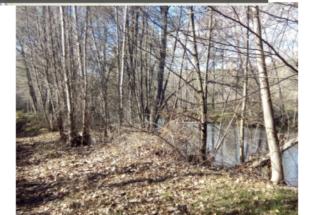
Ribera del Alberche