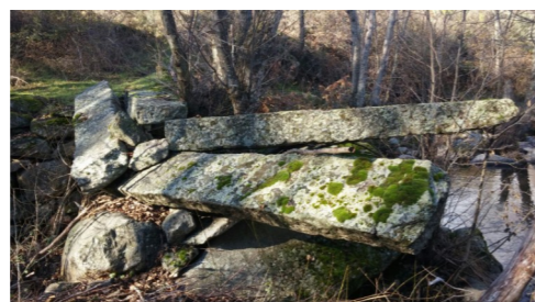
Antiguo paso del Arroyo de Navalayegua