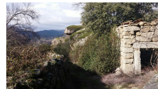
Saliendo de las Tórdigas