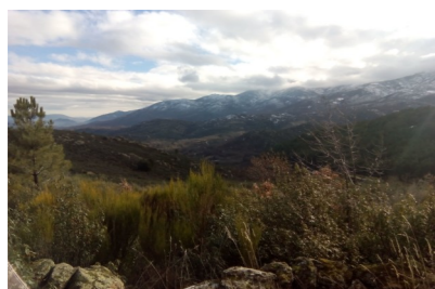
Paisaje inicio ruta