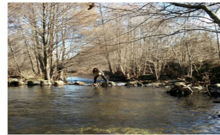
Paso en el Río Alberche